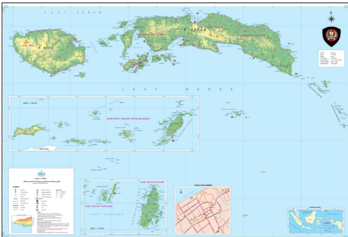
Gambar 1. Peta Administrasi Provinsi Maluku

19° 43" LS - 03° 20' 33" Lintang Selatan dan 128° 22' 55" - 128° 15' 17" Bujur Timur, dan terletak antara lain : sebelah Utara berbatasan dengan Desa Uraur, sebelah Selatan berbatasan dengan Desa Kairatu, sebelah Timur berbatasan dengan Desa Kairatu, dan sebelah Barat dengan Desa Gemba. Secara administratif daerah penelitian termasuk dalam Dusun Wae Sari Desa Kairatu yang berada pada wilayah Kecamatan Kairatu Kabupaten Seram Bagian Barat Propinsi Maluku (Gambar 1).