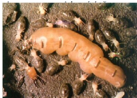
Gambar 2. Ratu Coptotermes curvignathus

ciri fisik yang sesuai dengan buku identifikasi jenis rayap yaitu jumlah ruas antena prajurit 14 –16,